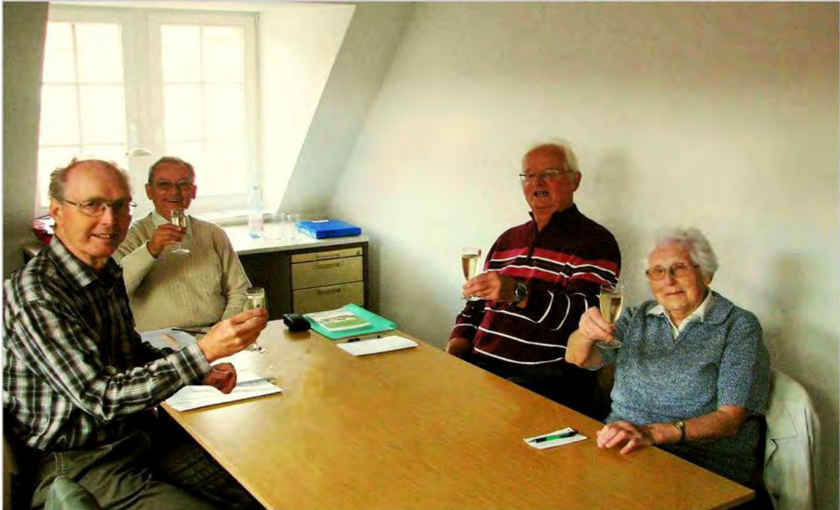
Neuer Arbeitsraum des Arbeitskreises Ortsgeschichte Lobeda- Altstadt im 2. Stock des Haupthauses im Kulturhaus „ Zum Bären“ Lobeda