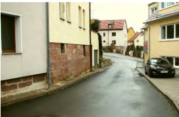
Stand 15. Dezember 2014