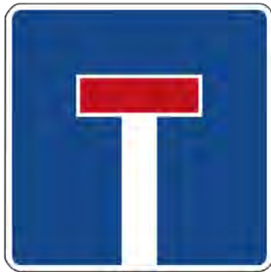
Zeichen 357 Sackgasse (Deutschland)

Dies ist aber bis heute noch nicht geschehen.