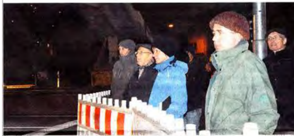
Trotz Kälte hatten zahlreiche interessierte Zuschauer bis zum Schluss ausgeharrt. Viele Fotos wurden in jener Nacht geschossen.