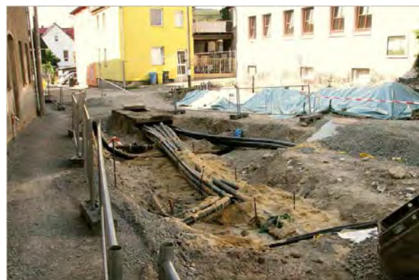
Stand 1. Bauabschnitt August 2014