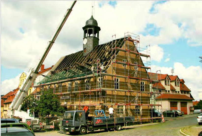
Baubeginn 14. August Jahr 2014