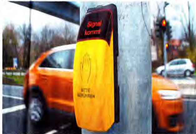
Aufforderung zur Kontaktaufnahme: Bis zu einer Minute kann es dauern, bis Fußgänger grün erhalten.

Die Zeitung maß gestern die Umlaufzeiten: Fahren viele Autos auf der Schnellstraße, dauerte es exakt eine Minute, bis die Fußgänger nach der Anforderung per Knopfdruck Grün bekommen. Gibt es Lücken im Straßenverkehr, kann es schneller gehen. Induktionsschleifen registrieren, wie viele Autos unterwegs sind und schieben dann Fußgängeranfragen ein. Manchmal in Sekunden. Thema Tempoverringerung: „Es ist nicht vorgesehen, nach der Ampelanlage die Fahrgeschwindigkeit wieder auf 70 km/h anzuheben“, sagte gestern Wolfgang Apelt von der Ver-