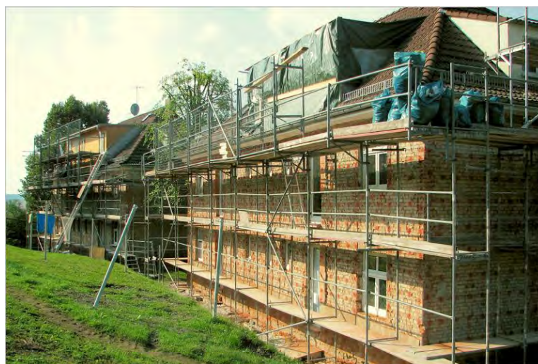
Stand September 2014