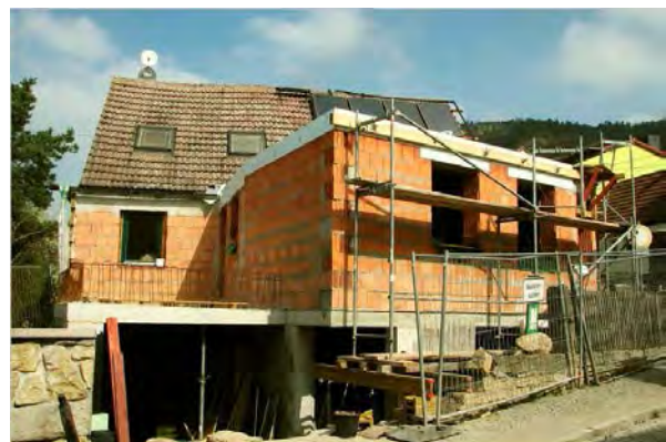
Stand 6. April 2014