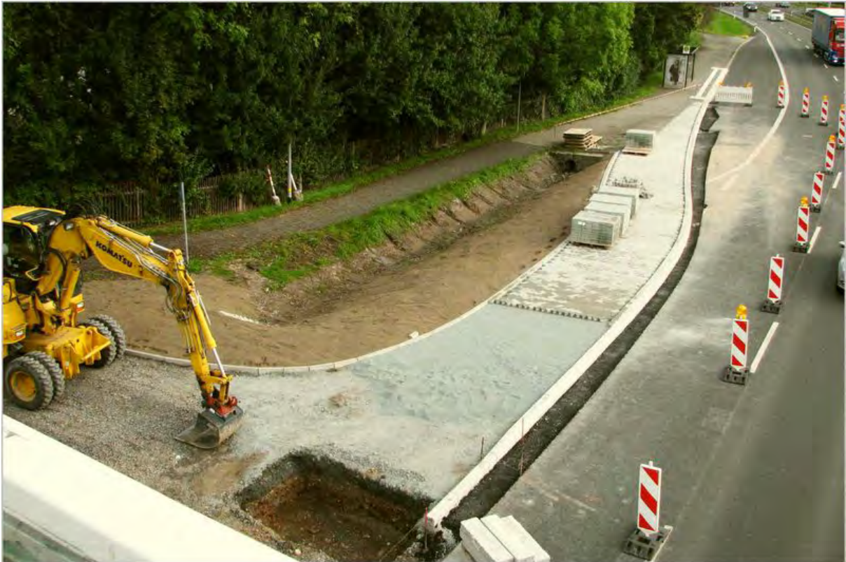
Der neue Fußgängerüberweg über die Stadtrodaer Straße mit Ampelanlage