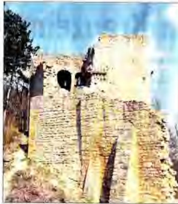
Die Ruine der Lobdeburg liegt auf einem Felsvorsprung zwischen den Fluren von Lobeda und Drackendorf.