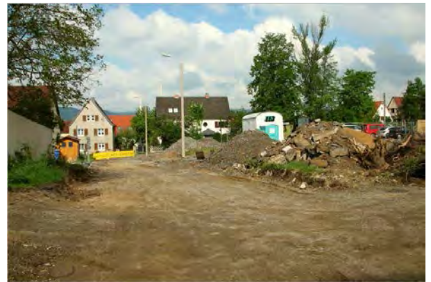
Stand Monat Mai 2014