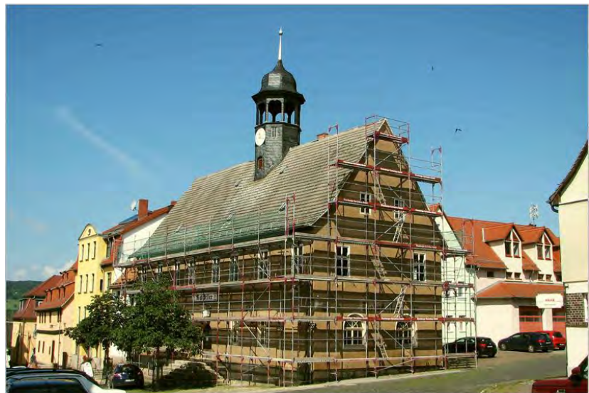
Stand Ende August Jahr 2014

Seit der Fertigstellung der neuen Dacheindeckung ruht die Bautätigkeit. Warum???