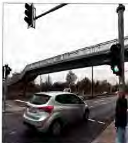
Fußgängerbrücke über die Stadtrodaer Straße und neuer ampelgeregelter Übergang.

Die neue Ampel wurde gebaut, weil eine Sanierung der Fußgängerbrücke teuer gewesen wäre. Die gestern von der Zeitung an der Brücke angetroffenen Fußgänger begrüßten auch überwiegend den Ampelbau. Der Abriss der Brücke ist für Sonnabend, 29. November, geplant. Nach derzeitigem Vorbereitungsstand soll ab 18 Uhr die Richtungsfahrbahn nach Lobeda gesperrt und der Verkehr wie bei den Triathlonveranstaltungen über die Gegenfahrbahn umgeleitet werden. Nach Abschluss der Vorarbeiten – so gegen Mitternacht – wird dann die gesamte Brücke mit einem Kran ausgeschwenkt. Dann wird der Verkehr kurz komplett angehalten. ► KOMMENTAR