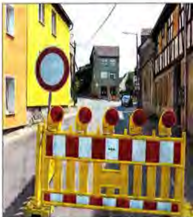
Schluss für Autofahrer ist nun schon ein gutes Stück vor der Susanne-Bohl-Straße

Auch die rechtzeitige ausführliche Information der Bürger durch den Kommunalservice