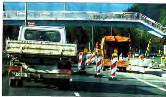
Die Tage der Fußgängerbrücke sind gezählt.

Wie geht es nun auf der Stadtrodaer Straße nach der Fertigstellung des Überweges samt LSA weiter? Wolfgang Apelt, Fachdienstleiter Verkehrsorganisation: Die Demontage der Fußgängerbrücke ist für den November geplant ist. Für die Demontage der Fußgängerbrücke werde an einem noch nicht genauer bestimmten Samstag jeweils eine Richtungsfahrbahn der Stadtrodaer Straße gesperrt und der Verkehr in diesem Zeitraum über die Gegenfahrbahn umgeleitet.