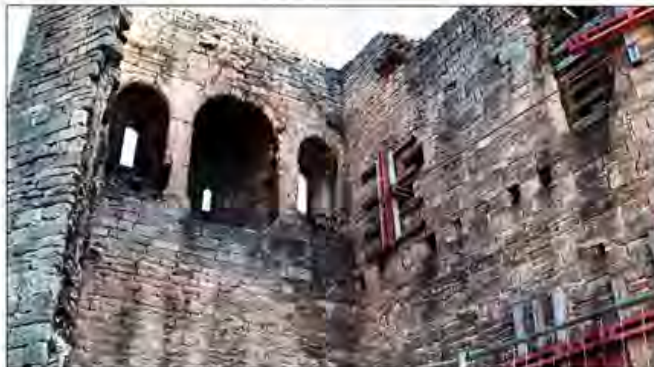
Das Innere des Palas der Lobdeburg-Ruine. Zu sehen sind die Notsicherungen am Gemäuer der weiter unvollendeten Baustelle.

Unbenommen davon hält der Verein weiterhin an der Forderung einer unverzüglichen Umsetzung der Investitionspläne von KIJ aus dem Jahr 2013 fest. Und die sieht eigentlich eine Sanierung in diesem Jahr im Wertumfang von 800 000 Euro vor.