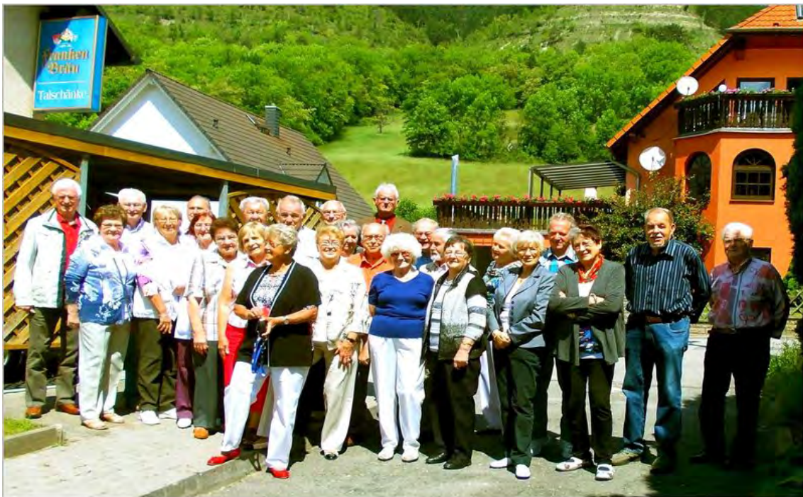
70- jähriges Zuckertütenfest Schuljahrgang 1944- 52, Grundschule Lobeda, Jahr 2014

Von links nach rechts, von oben nach unten: