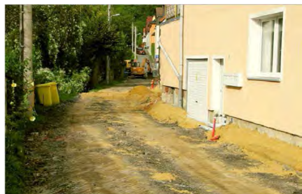
Stand 24. September 2014