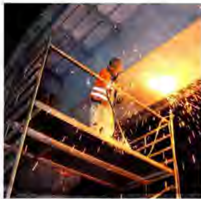
Löcher mussten an der Brücken-Unterseite geschweißt werden, damit Wasser ablaufen konnte.

Nach gut 35 Jahren sei sie aber nun wirklich vollkommen verschlissen, betonen die Experten. Sicherheitstechnisch halte sie den heutigen Anforderungen auch längst nicht mehr stand. Vor allem aber sei diese Brücke mit ihren hohen Treppenaufgängen natürlich nicht geeignet für Familien mit Kinderwagen oder Bürger mit Rollstühlen und Rolllatoren. Deshalb wurde eine Ampelanlage installiert, die nun die ebenerdige Überquerung der Schnellstraße bei Lobeda-Altstadt ermöglicht. ► KOMMENTAR