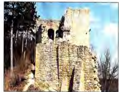
Die Lobdeburger hoffen weiter auf die Sanierung der Ruine. Ein neuer Termin war zur Jahresversammlung noch nicht zu hören.