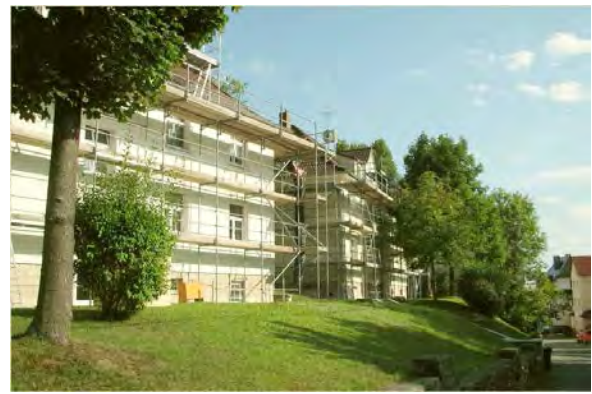
Stand August 2014