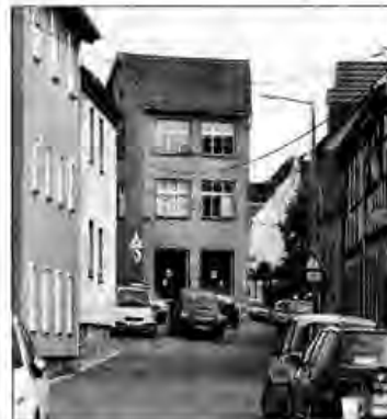
Auch die gesamte Kreuzung Jenaische Straße/Susanne-Bohl-Straße wird ab nächster Woche gesperrt.

Darin wurden auch die konkreten Inhalte der Baumaßnahme vorgestellt. Sie ist ein Gemeinschaftsvorhaben der Stadt Jena, von KSJ, des Zweckverbandes Jena-Wasser und der Stadtwerke Jena-Pöbbeck. So sollen ein Mischwasserkanal und Leitungen für Trinkwasser, Gas, Elektro und Informationstechnik neu verlegt werden.