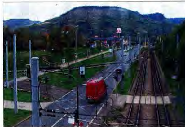
Gleiche Ansicht heute. Die grüne Wiese ist längst Geschichte. Statt dessen entstand ein Verkehrsknoten für die Stadt.

tungstechnisch unterstand. Dennoch hatten sich die Lobedaer immer standhaft geweigert, nach Jena eingemeindet zu werden. (Die Eingemeindung 1922 gegen den Willen der Einwohner wurde 1924 rückgängig gemacht.) Merkwürdigerweise verfolgten die Nazis die Eingemeindungspläne nicht weiter, feierten aber das Zusammenrücken Jenas und Lobedas über Straße, Brücke und Straßenbahn als ihre ureigene Idee, ungeachtet der Tatsache, dass die Pläne bereits fix und fertig waren, als sie 1933 an die Macht kamen. Das war die gleiche Masche wie auch bei den bereits seit 1925 geplanten Autobahnen, von denen gewisse Kreise immer noch glauben und behaupten, der „Führer“ habe sie erfunden.