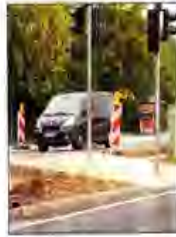
Der im Bau befindliche Fußgängerüberweg.

etwa drei Meter lange Fußweg zwischen den Fahrbahnen der Schnellstraße ein Gefälle von etwa zehn Prozent hat. Die eine Hälfte des Überweges ist mit rutschhemmenden Gehwegplatten gepflastert, die auch für Sehbehinderte gut tastbar sind. Auf dieser Seite gibt es auch eine kleine Bordsteinkante. Der Teil des Gehweges mit fahrbahnbindigem Bordstein besitzt normales Gehwegpflaster. Grund für das Gefälle der Mittelinsel ist die