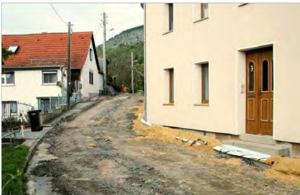
Stand 24. September 2014