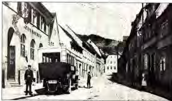
Was für ein Privileg in der Sommerfrische: Die Haltestelle des Nahverkehrs direkt vor der Haustür des Hotels „Zum Bären“ in Lobeda, um 1920.

Dem Verein ist zu wünschen, dass diese hochgesteckten Ziele erfolgreich realisiert werden. Das gesamte Haus in kürzester Zeit in vollem Glanz zu erleben, wäre der schönste Lohn für den Fleiß, die Mühen und die Arbeit aller Vereinsmitglieder. OTZ