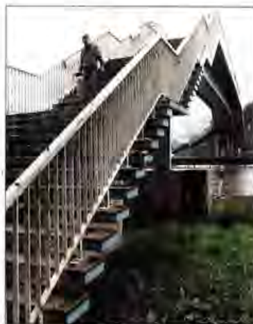
Ausgedient: die Fußgängerbrücke an der Stadtrodaer Straße in Altlobeda.

Dazu müsse man zunächst in den Verkehrsentwicklungsplan von 1993 und 2002 schauen, sagt er, denn dort seien bereits die Weichen hinsichtlich der grundsätzlichen Ziele für den