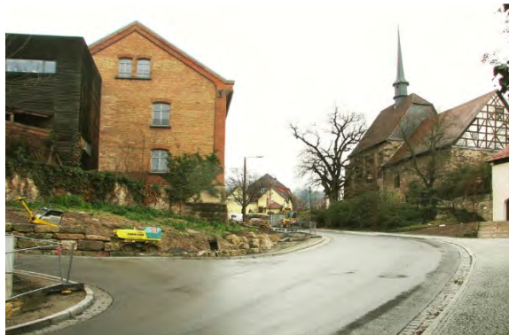
Stand 1. Bauabschnitt