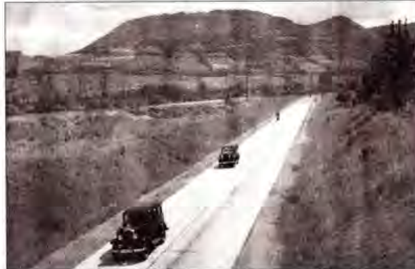
Baustelle im Jahr 1935: die Straße zwischen Winzerla und Lobeda. Links und rechts ist noch alles frei.

Das ganze Projekt des Straßenbaus einschließlich einer neuen Saalebrücke und der Straßenbahnlinie war nötig geworden, um das Städtchen Lobeda enger an das Jenaer Verkehrsnetz anzubinden, denn Handel und Gewerbe sowie Gastronomie und Ausflugsziele hatten mehr mit Jena zu tun als mit dem Amt und Kreis Roda, dem heutigen Stadtroda, dem Lobeda schon seit alters her verwal-