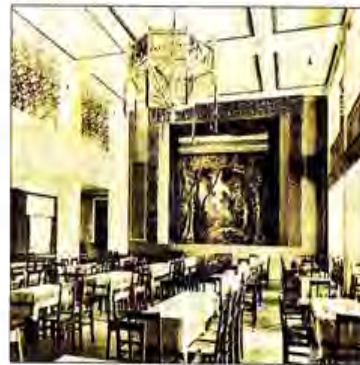
Der Saal des „Bären“ in Lobeda um 1916, jetzt muss er dringend erneuert werden.

Neue Eigentümer wurden nach dem Krieg in Folge die Stadt Jena, die Bau-Union Jena (Lehrlingswohnheim), die Universität Jena und zuletzt das Studentenwerk (Studentenwohnheim). Im ehemaligen Hotelbereich wurden Wohnungen für Lobedaer Bürger ausgebaut. Der Tanzsaal diente lange Zeit als Möbel- und Getreidelager, später als Turnhalle für die Grundschule Lobeda. Im Jahr 1953 bildete sich eine Bürgerinitiative mit dem Ziel, den Tanzsaal wieder kulturell zu nutzen. 150 Bürger Lobedas werkten ein Jahr