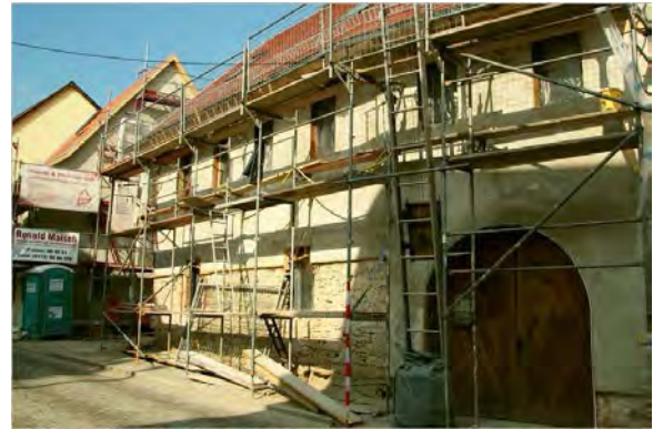
Stand 6. April 2014