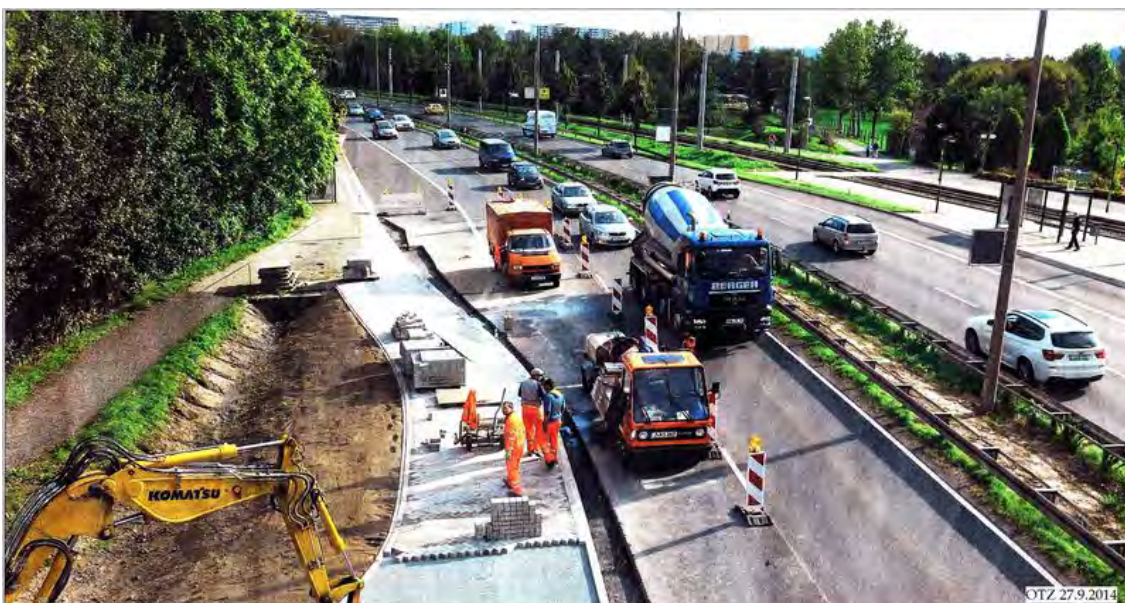
Ein neuer, gepflasterter Fußweg gehört dazu: Bau des Fußgängerüberweges auf Höhe Alllobeda. Die Fahrspuren werden schmaler.