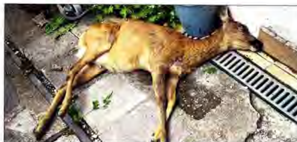
Trauriges Ende im Garten am Johannisberg: Gestern Morgen lag dieses Reh direkt neben einem Einfamilienhaus.

Bei der Feuerwehr erfuhr OTZ, dass der Anruf sofort behandelt worden sei. In solchen Fällen benachrichtigt man die Verantwortlichen vom Stadtförst. Man habe aber gestern niemanden schnell erreichen können. Über Umwege sei man dann an den Jagdpächter herangekommen. Doch die Jäger seien oft berufstätig und somit nicht gleich einsatzbereit. Als Hinweis in solchen Fällen: Sollten Wildtiere gefunden werden, so sollten sie nicht berührt und Abstand gehalten werden. Eine umgehende Information der Rettungsleitstelle/Feuerwehr, Telefon (03641)/4040, ist nötig.