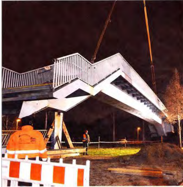
An langen textilen und stählernen Strängen hing die Fußgängerbrücke mit ihren gut 50 Tonnen Gewicht um 1.43 Uhr. Sicher wurde sie auf den Rand der Schnellstraße gehoben.