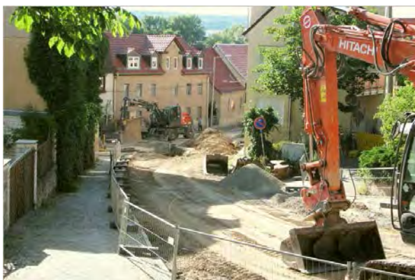
Stand 1. Bauabschnitt 23. Juni 2014