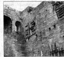
Die Ruine der Lobdeburg bleibt wohl weiter eine unvollendete Baustelle nach der Verschiebung der Sanierung auf 2018.

Reagiert hat auch der CDU-Bundestagsabgeordnete Albert Weiler: Er empfiehlt, beim Bund Fördermittel zu beantragen. 2013 hatte die Stadt bereits vom Land eine Fördermittel-Zusage erhalten, bisher aber nicht abgerufen, da KIJ Ende des Jahres die Sanierung stoppte.