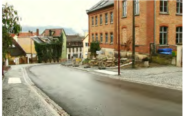
Stand 1. Bauabschnitt 19. Dezember 2014