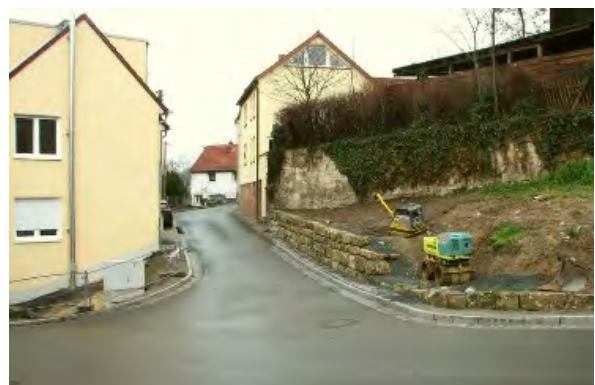
Stand 15. Dezember 2014