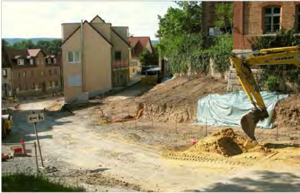
Stand 1. Bauabschnitt August 2014