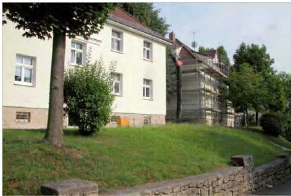
Stand Juli 2014